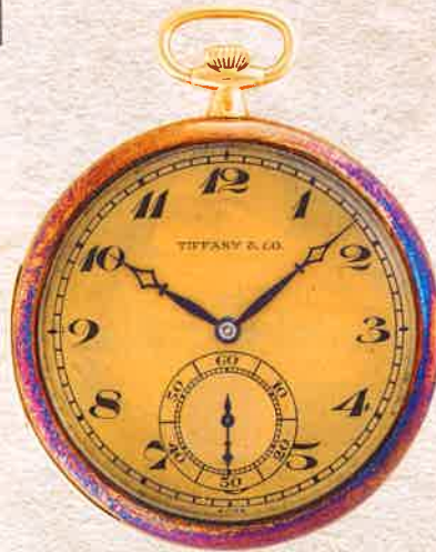
¥2,420,000 ティファニー / オーデマ ピゲ / ミニッツリピーター懐中時計 YG / 手巻き / 1910年代製