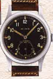
¥198,000 MIMO (ジラルール・ベルゴ) / ドイツ陸軍DH / SS、革ベルト / 手巻き / 1940年代製