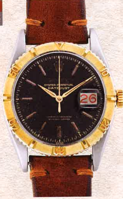
¥1,870,000 ロレックス / サンダーバード / Ref.6609 YG×SS、革ベルト / 自動巻き / 1950年代製、J.B.Chanpion社ジュビリープレスト付