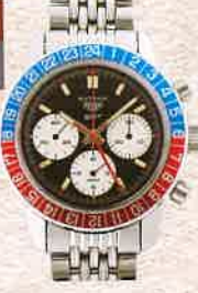
¥1,870,000 タグ・ホイヤー / AUTAVIA GMT / SS、手巻き / 1970年代製、純正バックル付き