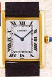
¥990,000 カルティエ / タンクイカルティエ エキストラフラット YG、革ベルト / 手巻き / 1970年代製、フレデリックピゲ Cal.98