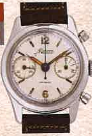
¥704,000 ミネルバ / クロノグラフ / SS、革ベルト / 手巻き / 1950年代製