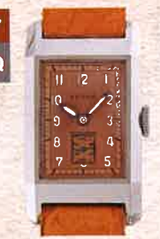
¥308,000 REVUE / レクタングュラー / SS、革ベルト / 手巻き / 1940年代製