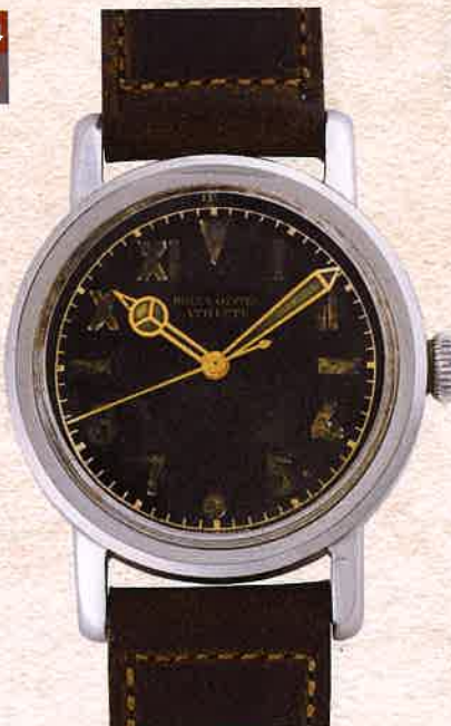
¥1,760,000 ロレックス / オイスターアスリート / SS、革ベルト / 手巻き / 1940年代製