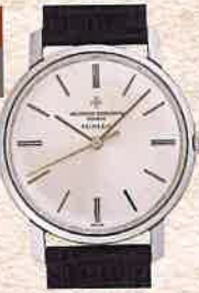
¥660,000 ヴァシュロン・コンスタンタン / チューラー-Wネーム SS、革ベルト / 手巻き / 1980年代製