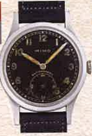
¥198,000 MIMO (ジラルール・ベルゴ) / ドイツ陸軍DH / SS、革ベルト / 手巻き / 1940年代製