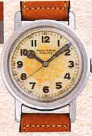
¥792,000 ロレックス / オイスターアスリート / SS、革ベルト / 手巻き / 1940年代製