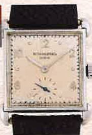
¥1,100,000 パテック フィリップ / 1535 SS、革ベルト 手巻き / 1948年製