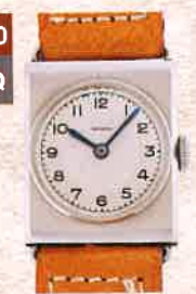
¥82,500 SIEGERIN / ALPINA、レクタングュラー / SS、革ベルト / 手巻き / 1940年代製、ミント、タグ付き