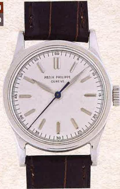
¥2,200,000 パテック フィリップ 2457 SS、革ベルト 手巻き / 1951年製